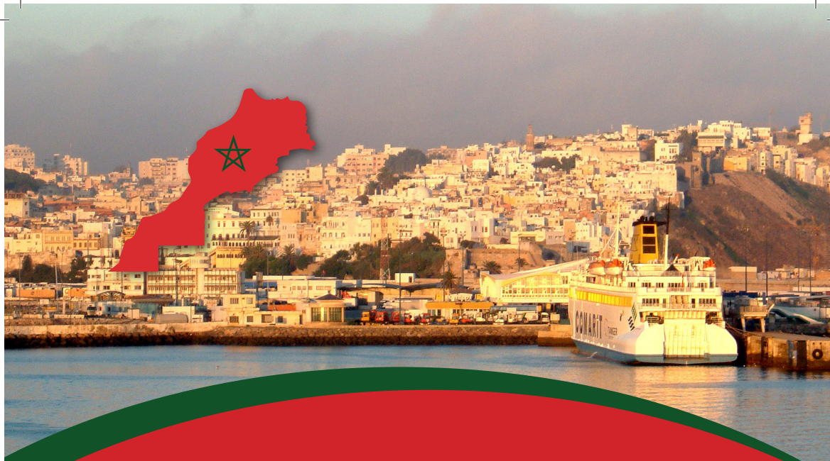
TABLE RONDE AGROALIMENTAIRE SUR LE MARCHÉ MAROCAIN, MARCHÉ CIBLE DE L'AWEX EN 2018

Les opportunités dans le secteur agroalimentaire